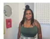
Voices Matter: Corrida on structural racism How to talk about racism to black people? How to talk about it to children? And why we shouldn't just ignore it - Corrida joined on 'Voices Matter' to talk about these matters. Oct 25, 2023